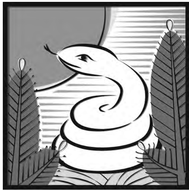
完全な悟りの世界に入る事を蛇の脱皮になぞって

蛇は七福神の1つ弁財天にゆかりの生き物である。弁財天は、財宝、才能、言語の神とされ、特に蓄財の弁天様として崇拜されて来た。また、蛇に逢ったり、夢を見たりすると金運が良いとされ、蛇のぬけがらを財布に入れておくとお金が貯まるとの言い伝えもある。その理由は蛇は何度も脱皮して成長していくことから、この脱皮は成長を金持ちになることなのである。 蛇の脱皮と仏陀のことは仏教の古い教典「スッタニパーダ」には「蛇の章」がある。そこには「内に怒ることなく、世の栄